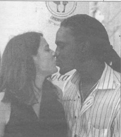
posati lo scorso anno durante Eurochocoalte